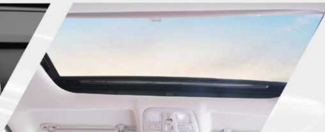
< فتحة سقف كهربائية