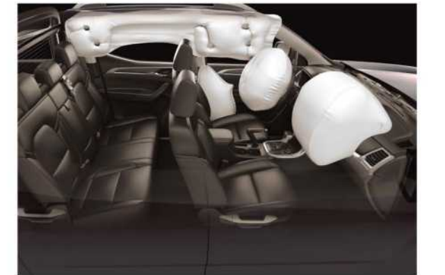
وسادات هوائية 6