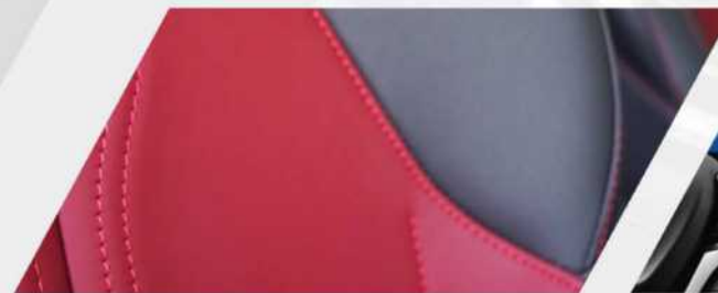
< مقاعد جلد فاخرة