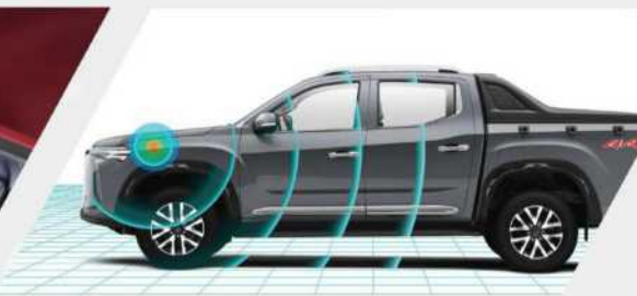
< نظام عزل الضوضاء والاهتزاز والخشونة (NVH)