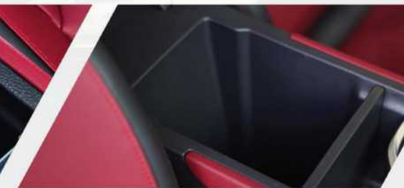
< مندوزق تبريد