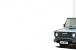
1907 تطور سريع

مع دخول منزل وندسور إلى السلطة ، حظيت نماذج ليلاند بشرف الانضمام إلى موكب السيارات الإمبراطوري