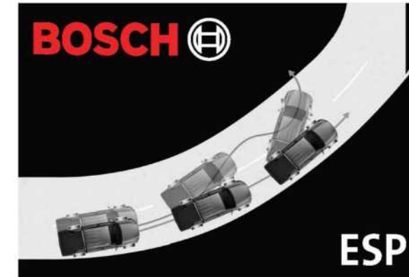
برنامج الثبات الإلكتروني من بوش

الحديث عن الأداء والذكاء والتصميم ولكن تجاهل السلامة هو غير منطقي يمكن أن يؤدي تجنب الخطر وتحمل الصدمات إلى الحماية والسلامة