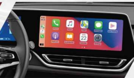
< شاشة ترفية متعددة الوسائط مع كار بلاي