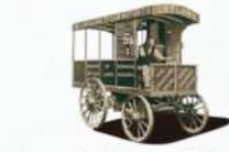
منذ قرن من الزمان ، وصل طراز LDV البريطاني ، والذي يعتبر البداية الأسطورية لـ ماكسوس V80

سوق المركبات التجارية الدولية بجهودها المستمرة للتوسع المبتكر. يتم الآن رؤيتها في جميع أنحاء العالم وهي معروفة باسم العلامة التجارية الدولية الأسطورية للمركبات التجارية في عام 2009 ، قامت شركة سايك موتور ، Fortune 500 في العالم ، بالاستحواذ الكامل على منصة تكنولوجيا شركات السيارات البريطانية والمثقفين ، قامت بالاستحواذ الكامل على منصة تكنولوجيا لشركات السيارات البريطانية وحقوق الملكية الفكرية لعلامة ماكسوس التجارية. تم تقديم ماكسوس إلى الصين وأطلق عليها اسم "da tango" بالصينية. هذه المبادرة لا تضع فقط علامة فارقة جديدة في تطوير المركبات التجارية في الصين ، ولكن أيضًا بشرت بإصدار جديد رائع من العلامة التجارية الأسطورية ماكسوس