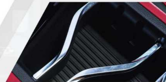
< منطقة تخزين بحواجز قابلة للتعديل بالمنتصف