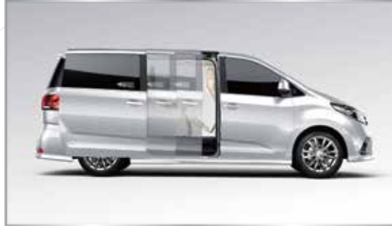
بابين سحب من الجهتين