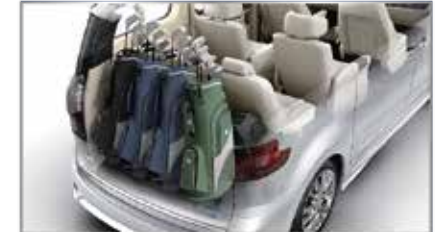
مساحة امتعة تصل 2500 لتر