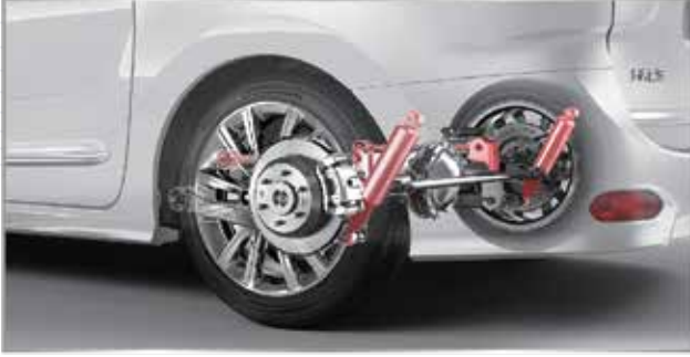
نظام القيادة الاتوماتيكية للراحة الكاملة