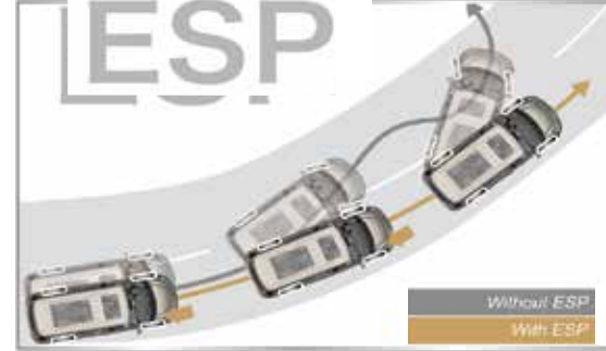
أحدث جيل من نظام Bosh Esp9 الإلكتروني للمساعدة في الاستقرار و التحكم الكامل في السلامة